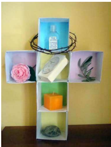
Alcuni esempi di Angolo della croce